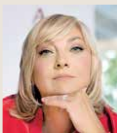
ANA GOVEDARICA POTPREDSEDNICA I PORTPAROL SAVETA STRANIH INVESTITORA (GENERALNA DIREKTORKA KOMPANIJE ROCHE)

Poreska uprava svim svojim aktivnostima potvrđuje jednu od ključnih uloga u borbi protiv sive ekonomije u Republici Srbiji. Nastavlja da radi na svojoj transformaciji. Uskoro počinje sprovođenje novog poslovnog modela koji će biti podržan jedinstvenim integrisanim informacionim sistemom