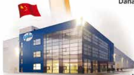
MINTH AUTOMOTIVE EUROPE