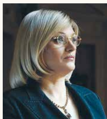
JORGOVANKA TABAKOVIĆ, guverner NBS