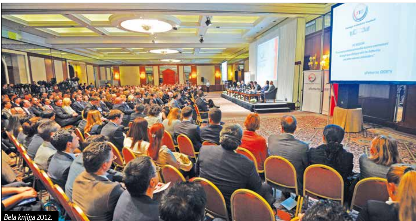
Bela knjiga 2012.

Od svog osnivanja Savet stranih investitora vođen je istim principima – doslednost, transparentnost, jednakost i predvidljivost. Danas, kao i u prošlosti, FIC je agilni promoter predvidljivog i jasnog poslovnog okruženja, istih pravila za sve i dobre poslovne etike