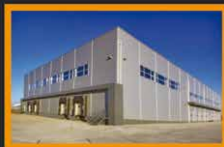
2014. Kalman 2