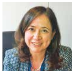
HENOVEVA RUIS KALAVERA, direktorka za Zapadni Balkan u Generalnom direktoratu Evropske komisije za evropsku susedsku politiku i pregovore o proširenju