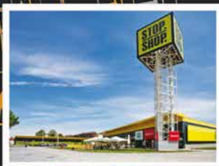
2016. STOP SHOP, Niš