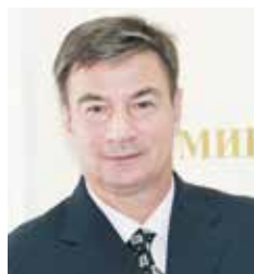
GORAN KNEŽEVIĆ, ministar privrede Vlade Srbije