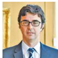
SEBASTIJAN SOSA, stalni predstavnik MMF-a u Srbiji