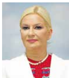
PROF. DR ZORANA MIHAJLOVIĆ, potpredsednica Vlade Srbije i ministarka građevinarstva, saobraćaja i infrastrukture