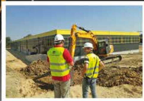
2017. STOP SHOP, Lazarevac, svečano otvaranje u septembru