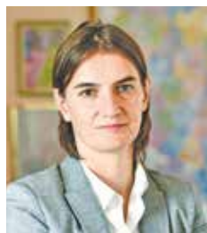
ANA BRNABIĆ, predsednica Vlade Republike Srbije