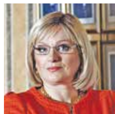
JORGOVANKA TABAKOVIĆ, guverner NBS