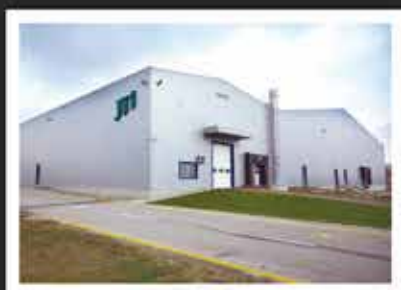
2013. JT International 1