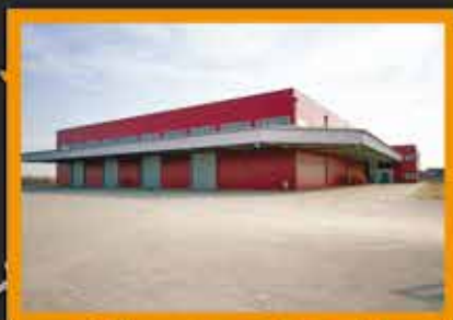
2013. Kalman 1

Najveći uspeh kompanije je zadovoljan investitor koji se svaki put obraća Konstruktoru za projektovanje i gradnju jer, »KONSTRUIŠEMO VAŠU VIZIJU«