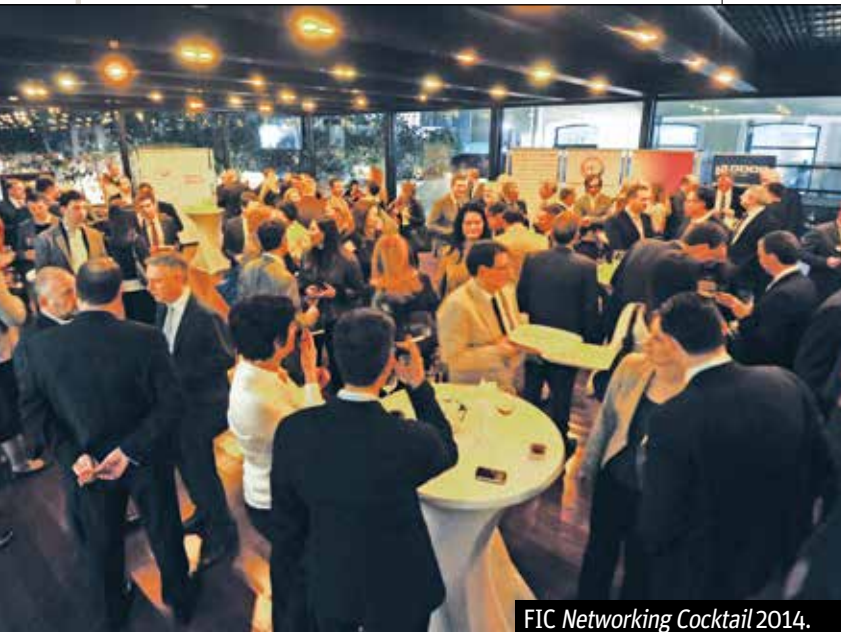
FIC Networking Cocktail 2014.

Događaj je rezultirao zajedničkim zaključkom da FIC i Vlada treba da prodube saradnju blagovremenim stručnim dijalogom u kojem će Vlada izneti svoje planove reformi, a privatni sektor će oceniti da li su ova rešenja izvodljiva u datom vremenskom okviru i kako će to uticati na poslovanje i, konačno, na BDP zemlje. ■