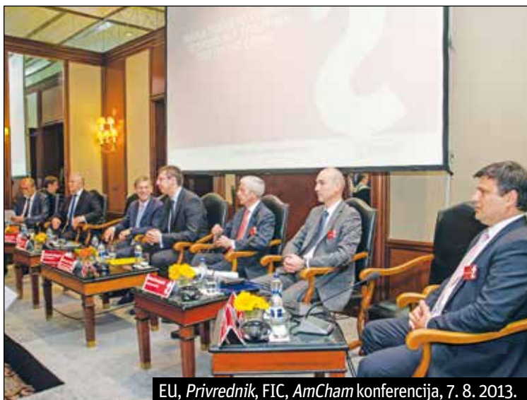
EU, Privrednik, FIC, AmCham konferencija, 7. 8. 2013.

Rad odbora je izuzetno značajan jer oni konstantno sprovode analizu trenutne poslovne klime i procenjuju postojeće zakonodavstvo i sprovođenje zakona. Članovi odbora ak-