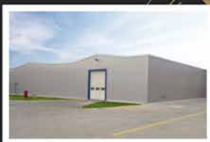
2014. JT International 2